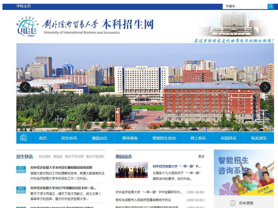
图5 本科招生网首页

宣讲会、招生热线、高招咨询会、网络媒体采访、直播、在线答疑等多种方式，广泛宣传我校年度办学特色、招生政策、程序规则，实时发布录取结果，学生录取信息、录取通知书发放情况都可通过本科招生网、微信公众号等渠道进行查询和服务。