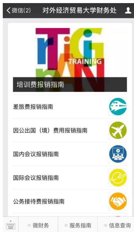
图 6 财务微信公众号

进一步加强财务信息网站建设，通过财务信息网公开学校综合财务信息、财经法规政策、服务指南、教职工财务信息等。建成包含网上报销、预算申报、薪酬发放、财务查询等功能丰富的综合财务平台。2016-2017 年度新启动了网上报销和缴费平台，重塑了报销和缴费流程，不但方便了师生，也提高了工作效率。