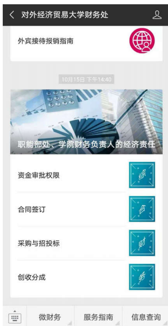
图6 财务微信公众号

⑤建设财务处微信公众号。该公众号包括：微财务、服务指南和信息查询3大板块，涉及通知公告、政策解读、院长手册、收费及E卡通、财务报销、公务卡、工资和公积金查询等各项业务，以更便捷的方式提供各种财务信息查询服务。