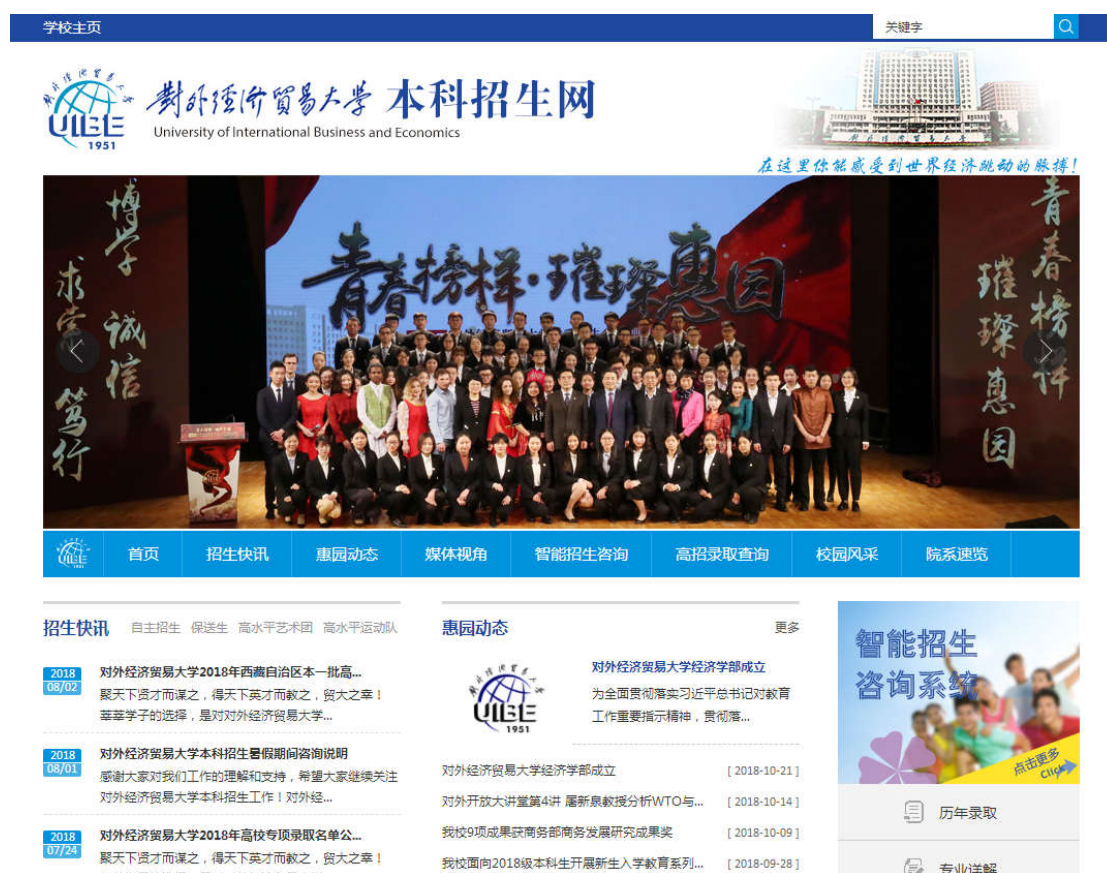
图5 本科招生网首页

三是进一步完善信息反馈途径。我校在公布招生录取信息时会附以信息反馈途径，包括我校招生办咨询电话、传真、申诉邮箱、举报邮箱，针对每起申诉、疑问，我办均会高效率进行信息核实、复查结果，第一时间答复考生及家长，确保申诉必查、举报必究。